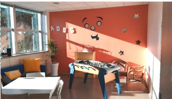
La salle « Ados »

Il nous semble important de souligner que la dynamique de Pôle favorise selon nous la fluidité des échanges d'une équipe à l'autre sur des temps formels et informels. Favoriser le passage des informations optimise, de fait les accompagnements, notamment dans le cadre des permanences.