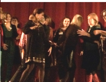
Les professionnels d'EFM ont participé à la représentation théâtrale avec beaucoup d'enthousiasme.