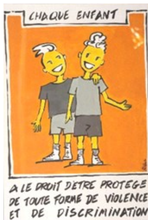
Affiches réalisées par Damien Racine, artiste peintre

Certains parents ont également expérimenté le travail de l'argile avec satisfaction et investissement.