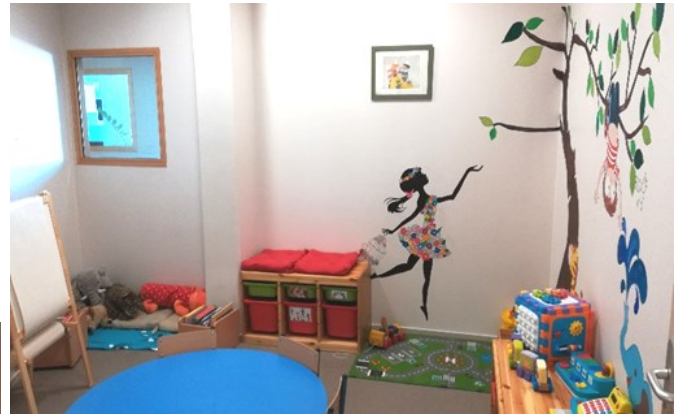
La salle « Petite enfance »

En réaménageant le Pôle, nous avons veillé à rendre singulier, chaleureux et accueillant chacun des espaces afin qu'ils soient adaptés aux différents publics accueillis. L'objectif étant de