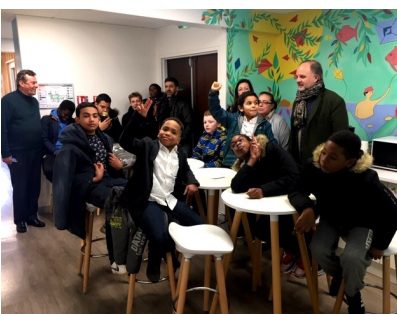
La joyeuse équipe visite les locaux de la Direction générale

À la demande d'un représentant, une boîte à idées sera installée dans chaque pavillon pour recueillir l'expression des enfants qui souhaiteront faire part de leurs propositions.