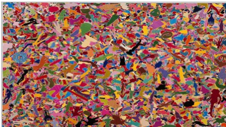
Alighiero Boetti (1940 - 1994) Broderie réalisée à Peshawar, par des afghanes réfugiées au Pakistan Tutto (Tout) 1987 Broderie à la main sur lin. 174 x 251 cm

La dernière œuvre que nous découvrons est entièrement constituée d'objets multicolores brodés. L'artiste a demandé à des femmes afghanes de broder chacune un objet de leur quotidien. Nous nous amusons à découvrir tous les objets cachés sur cette grande tapisserie. Chaque enfant choisit par la suite son objet préféré que la conteuse fait mine de lui offrir.