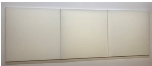
Robert RYMAN (1930 - 2019) Sans titre printemps 1974

La première œuvre du parcours est un triptyque monochrome blanc. La conteuse incite les enfants à imaginer ce qu'ils pourraient dessiner sur l'un des grands panneaux. Chacun nous fait part de sa proposition. Il y a beaucoup d'animaux en tous genres et toujours... BLANCS.